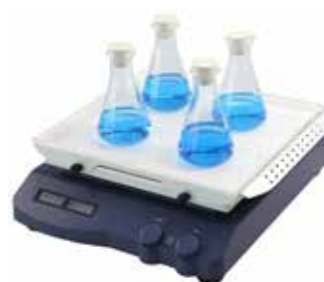
Con supporto in gomma antiscivolo