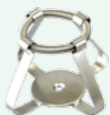
Clips per beute 100 ml Max per supporto n.16 Codice 22006473