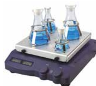
Con supporto forato e clips per beute