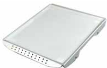
Supporto con pellicola antiscivolo Codice 22006223