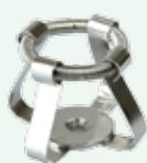
Clips per beute 25 ml Max per supporto n.28 Codice 22006453