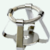
Clips per beute 50 ml Max per supporto n.28 Codice 22006463