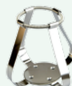
Clips per beute 500 ml Max per supporto n.9 Codice 22006493