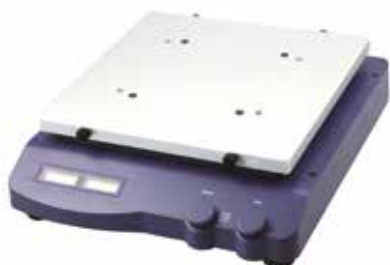
Agitatore senza supporti