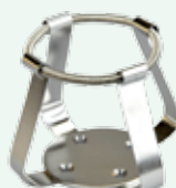
Clips per beute 200/250 ml Max per supporto n.9 Codice 22006483