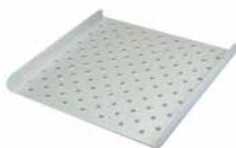
Supporto forato per fissaggio clips Codice 22006243