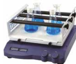
Con supporto universale a rulli regolabili