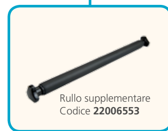
Rullo supplementare Codice 22006553