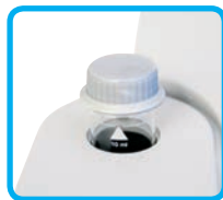
Vials con tappo a tenuta di luce