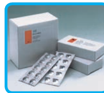
Compresse predosate in blister in alluminio