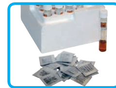
Bustine di reattivi Vario e provette per COD