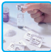
Reattivi in polvere Vario