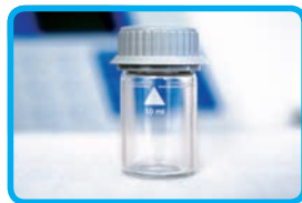
Vials per l'analisi del campione