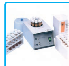
Termoreattore per analisi COD