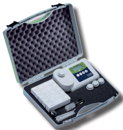
Fotometro con valigia di trasporto