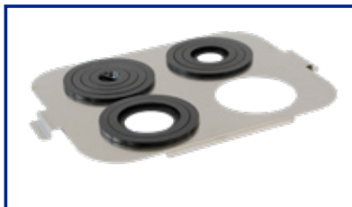
Supporto Becker per DU-100 S