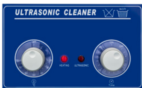
Pannello frontale serie AU