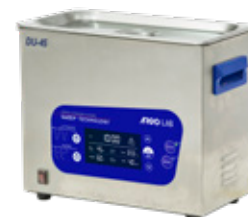
DU-32S | 45S | 65S