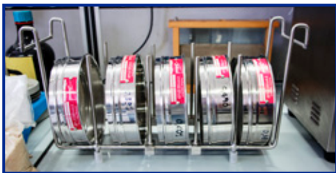
SS-200 con setacci