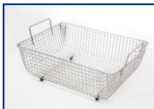
Cestello compatibile con tutti i modelli

* SS-200 non incluso nella confezione standard.