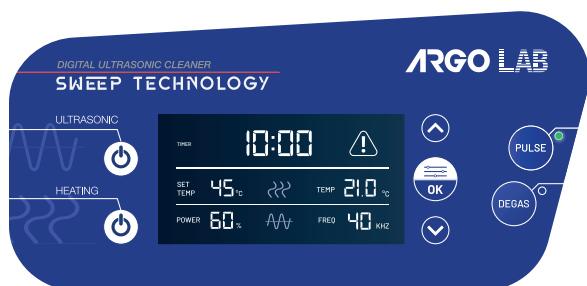
Pannello frontale Serie DU Sweep Technology