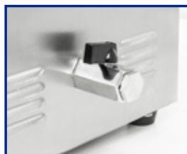
Valvola di scarico per i modelli DU-100 S, DU-220 S, DU-450 S, AU-220 e AU-450