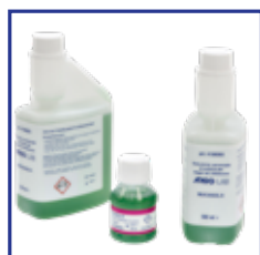
Soluzione di pulizia per tutti i modelli

* SS-200 non incluso nella confezione standard.