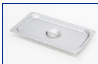
Coperchio in acciaio inox per tutti i modelli